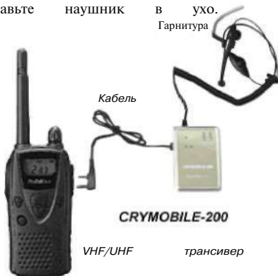
Рис.3. Соединение CRYMOBILE-200